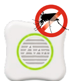
Stechmücken Art.-Nr. 66993