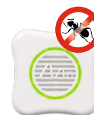
Ameisen Art.-Nr. 66996