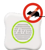
Mäuse Art.-Nr. 66994